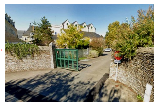
Rue du 8 mai 1945 Accès artiste par l'arrière du Théâtre + Accès hébergement

→ Accès privé de l'arrière du théâtre à la maison (uniquement à pied)