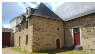
Maison : mise à disposition pour les artistes

A votre arrivée, vous pouvez stationner sur le parking à l'arrière du théâtre. L'accès se fait par la « rue du 8 mai 1945 », (grand portail vert). Vous arriverez ainsi directement au théâtre – côté arrière scène