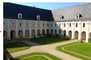
Théâtre des Ursulines