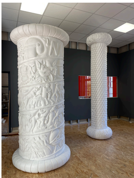
Le temps des cerises

Invente, dessine et colorie ta propre colonne sans oublier de lui donner un nom !