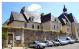
Théâtre des Ursulines

4bis rue horeau : Accueil / Billetterie / Administration du Carré.