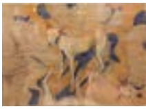
« Chiens de Saqqarah », 1990-93, Acrylique sur papier paille, 105 x 735 cm