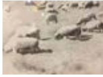
« 3 dessins de moutons », 1970 - Graphite et acrylique sur panneau de bois sous plexis, 34 × 41 cm