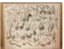
« D'après Ingres, pieds, mains, seins », 2008 - Acrylique sur toile, 150 × 185 cm