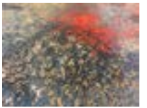
« Tas de feuilles en feu », 1995, Acrylique sur papier paille, 201 X 285 cm