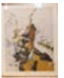
« Femme et mouton », 1967 - Huile et crayon sur papier, 65 x 50 cm