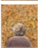
« Autoportrait aux giroles », 2002 - Acrylique sur toile, 92 x 65 cm