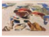
« D'après Poussin » (5 variations sur le massacre des innocents), 1998 - Lavis et graphite sur papier chiffon, 37 × 52 cm