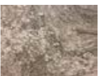
« Carottes sauvages », 2013-14 - Encre sur toile fine polyester préparée, 54 × 65 cm