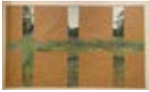
« Croisée de fenêtre triple », 1982 - Crayon graphite et acrylique couleurs sur papier paille, 185 X 313 cm