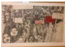
4 dessins de la période des « Hommes rouges », 1968-69 - Graphite et feutre ou lavis sur papier, 30 x 40 cm