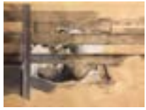
« La bétailière », 1977 - Lavis et graphite sur papier chiffon, 75 × 105 cm