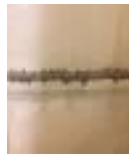
« Canicules / saxifrages », 2004 - Lavis et graphite sur papier chiffon, 105 × 73 cm