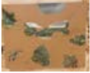
« Fragments de paysage orange et vert », 1985-89 - Acrylique et crayon sur papier, 200 x 200 cm