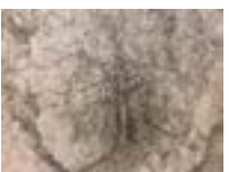
« Arbre centré (arbre sec dans pré Serindon) », 2013-14 - Encre sur toile fine polyester préparée, 60 × 73 cm