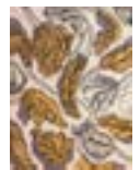
« Pawlownia ocre jaune et bleu », 2003 - Acrylique sur toile polyester et chassis, 162 x 130 cm