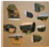
« Fragment d'un paysage », 1979-86 - Acrylique sur toile de lin non préparée, 73 x 92 cm