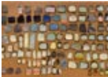
« Le journal du ciel », 1989-90 - Acrylique sur ardoises fixées sur panneau, 189 x 313 cm