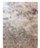
« Sous les noyers », 1988-1990 - Crayon et lavis d'acrylique sur papier couché blanc, 210 x 130 cm