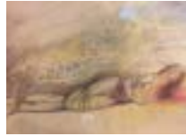
« D'après David » (La mort de Bara - 4 études), 1995 - Lavis et graphite sur papier chiffon, 30 × 40 cm